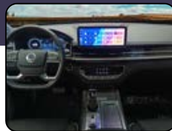
Centro de entretenimiento de 12" con CarPlay y Android Auto