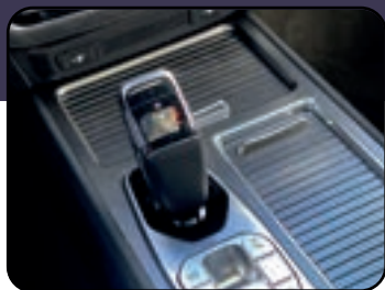
4x4 con bajo transmisión electrónica Shift By Wire con 8 velocidades