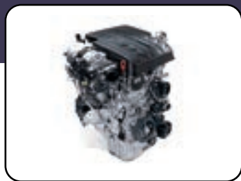
Motor 2.2 TURBO Diésel con 200 HP y 441 NM