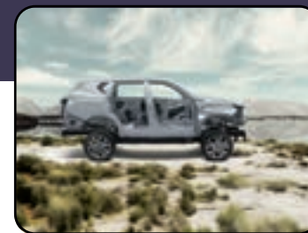
Máxima seguridad Chasis reforzado, 6 airbags, hasta 15 asistencias de seguridad.